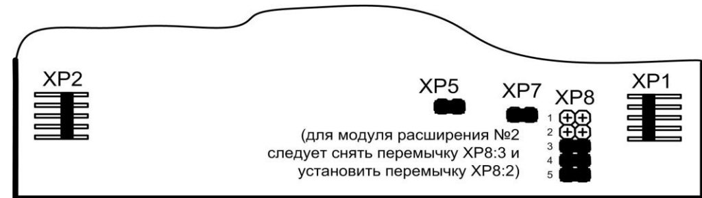
Рисунок 2. Расположение контактов и контактных колодок на печатной плате модуля расширения.

Питание на модуль расширения подается с модуля базового через соединительный кабель, подключаемый к разъему XP2.